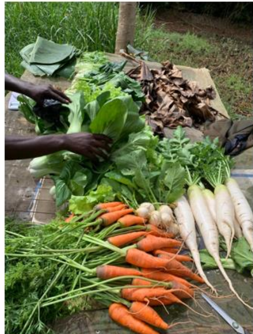
Nachhaltige Verpackung: Die Ernte wird zur Auslieferung in Bananeblätter gewickelt.

An die Arbeit in den Tropen hat sich mein Körper einigermaßen gewöhnt. Außerdem fühlt es sich sofort besser an, wenn neben dir auch jemand stöhnend und schwitzend schuftet.