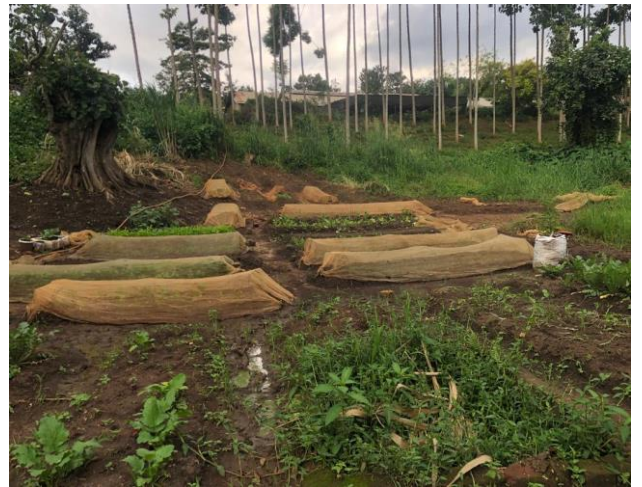
Ein Teil unseres japanischen Gartens