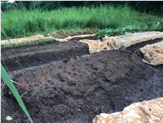
Die Ridges – unsere Hochbeete