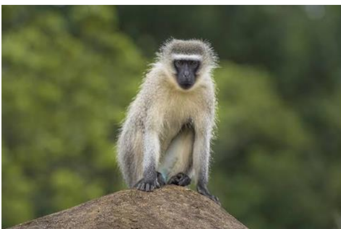
Die Grüne Meerkatze

Neben der Instandhaltung unseres asiatischen Gartens, kümmern wir uns um unsere Maisfelder, die Kassava-Pflanzen und die Bananenpalmen, die regelmäßig getrimmt werden müssen. Klingt nach nicht so viel, reicht aber locker für fünf volle Arbeitstage.