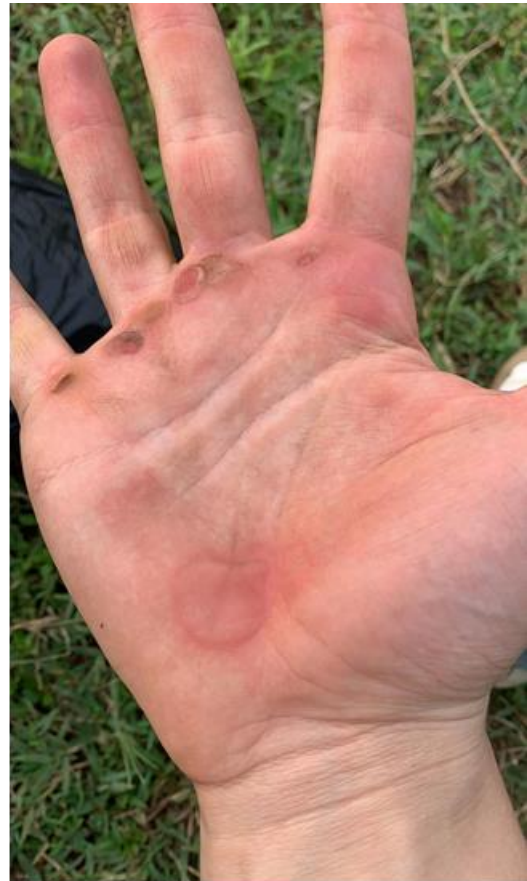
Bohnenernte per Hand - und meine Hände nach dem Maispulen

Für mich ist die Arbeit sehr erfüllend, körperliche Arbeit bringt mir großen Spaß. Ich glaube, weil man am Ende des Tages sieht, was man geschafft hat.