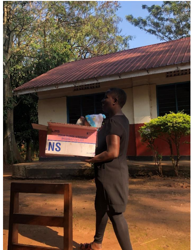
Baby in a Box

Ich kann es nur noch einmal wiederholen, wie komisch es ist, dass jetzt doch schon mehr als die Hälfte meines Freiwilligendienstes vorbei ist. Die nächsten Monate werden nochmal spannend, weil ich erneut Besuch bekomme und damit auch noch die Chance habe mir Nairobi/Kenia anzuschauen. Zusätzlich werde ich ein weiteres Mal das Department wechseln und mir für eine Zeit das Krankenhaus anschauen. Ich bin gespannt was kommt, die Zeit fliegt.