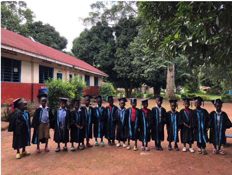
Die Kinder der Top-Class bei der Graduation.

Nach und nach habe ich mich daran gewöhnt und mittlerweile macht es mir richtig Spaß mit den Kindern zusammenzuarbeiten. Da die Winterferien hier von Dezember bis Februar sind, haben wir die Schüler*innen auf die Graduation Feier vorbereitet, bei der sie gelernte Inhalte vor den Eltern vortragen sollen. Die Kinder der Top Class, welche im nächsten Jahr dann in die Grundschule gehen, bekommen eine Robe und einen Hut und sehen super smart aus 😊 Nach der Graduation habe ich noch zwei Wochen im Treeplanting gearbeitet, bis ich kurz vor Weihnachten Besuch aus Deutschland bekommen habe!