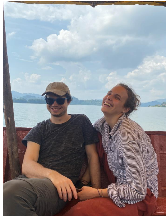
Happy People 😊