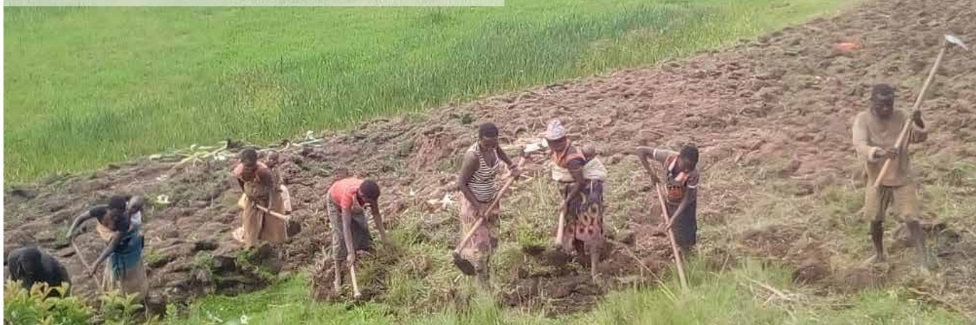
Les membres de l'association « Giringoga » dans leur champ