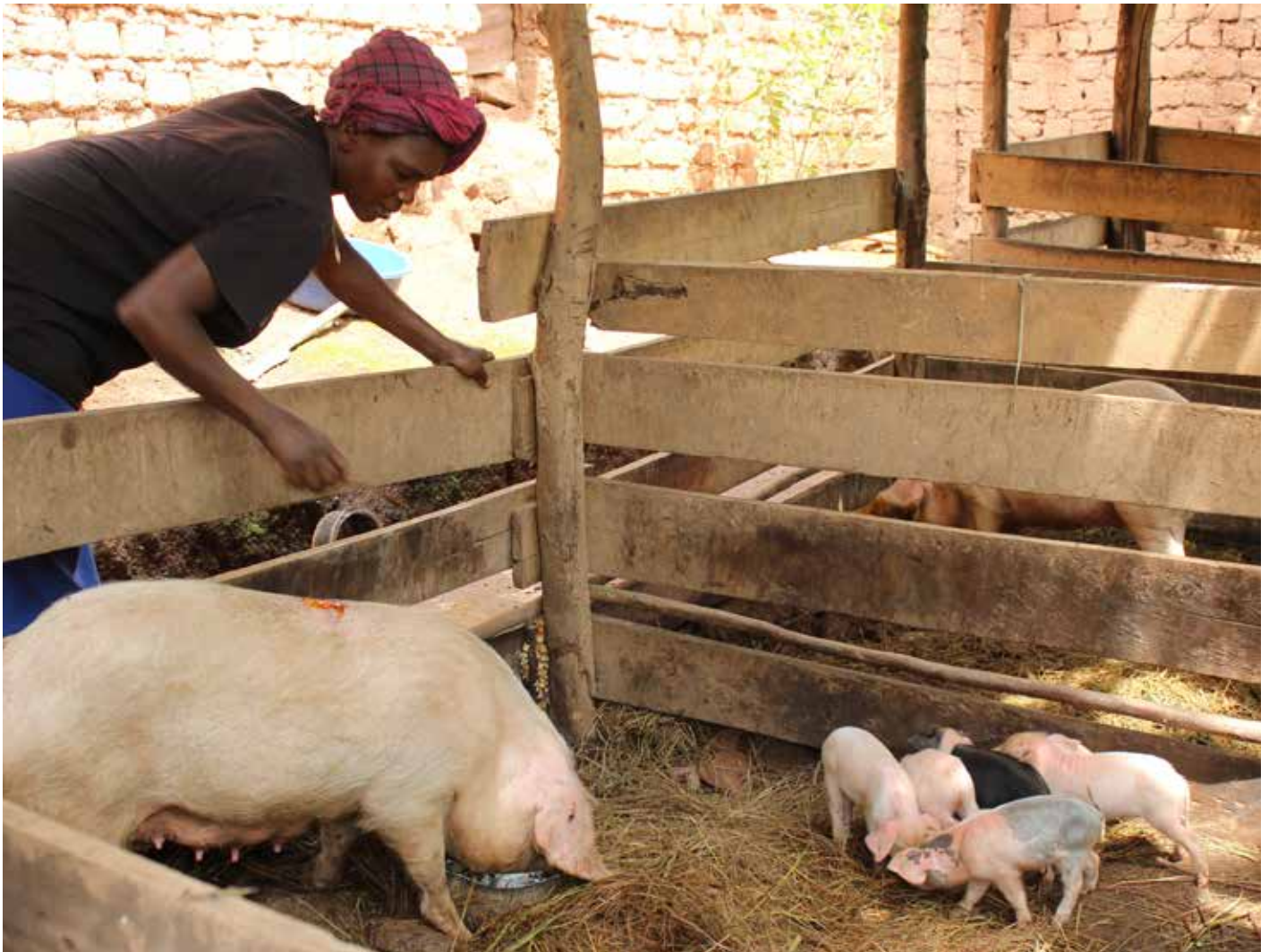
Un bénéficiaire de l'association «Kerebuka-CHIRO» dans sa porcherie

Grâce au projet Fonds d'Appui aux Initiatives Rurales (FAIR), les responsables des associations bénéficiaires du projet améliorent leurs plans d'affaire. Cela les aidera à mieux planifier pour avoir plus de profit. Ce qui pourra améliorer les conditions de vie des bénéficiaires. Mais, en dépit de la nouvelle dynamique, il subsiste des défis !