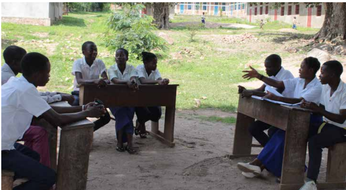
Réunion du Cours Scolaire de Paix (CSP) de l'institut Shata

Le projet « Tuvumiliane (Tolérons-nous les uns les autres) » mis en œuvre par l'organisation « Femmes Artisanes de la Paix (FAP) » en partenariat avec EIRENE Grands Lacs collabore avec 03 écoles secondaires du Territoire d'Uvira au Sud-Kivu (RD Congo) pour l'éducation à la paix. Cette collaboration a pour but de renforcer les actions de cohésion sociale et de transformation non-violente des conflits au sein des établissements scolaires en particulier et des communautés en général.