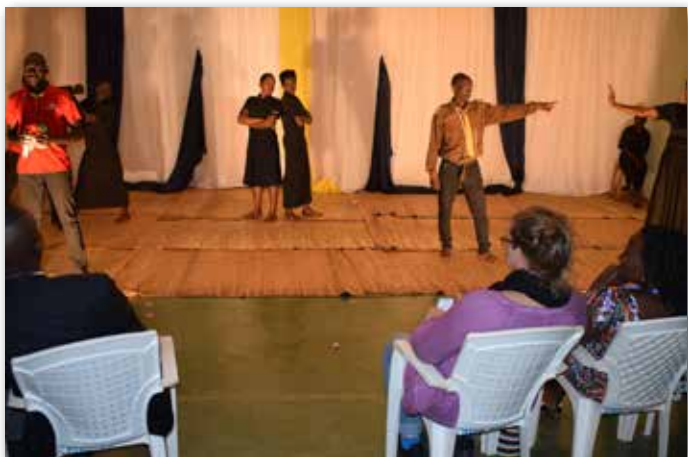
Présentation de théâtre à Gitega

Chargés de projets, représentants des Organisations Partenaires (OP) d'EIRENE du Sahel et des Grands Lacs ainsi que les Assistants Techniques de Paix (ATP) étaient réunis du 05 au 09 décembre à Bujumbura. C'était pour un échange d'expériences et un renforcement mutuel entre les programmes « Promotion de la Paix au Sahel (PPS) » et « les Femmes et les Hommes ensemble organisés et engagés pour la Paix juste dans leurs Communautés (FeHoPaCo) ». Les participants à la rencontre se disent désormais mieux outillés pour contribuer à la paix.