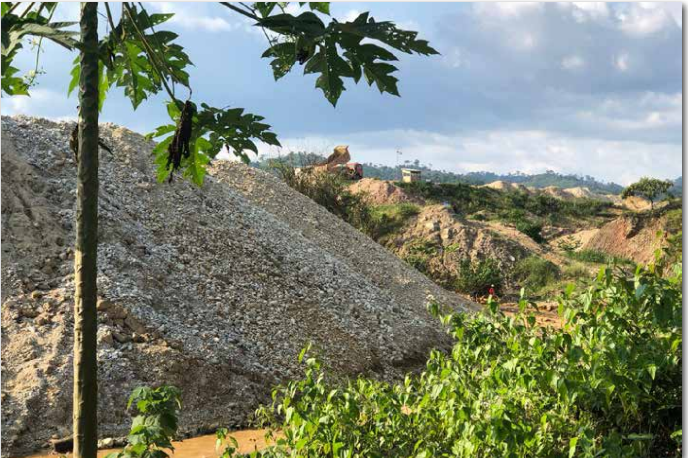
Site d'exploitation minière dans la chefferie de Wamuzimu

L'Association pour la Défense des Droits des Victimes des Actions des Entreprises Minières (ADVEM) est une structure du projet « Madini Kwa Umoja na Amani (l'exploitation minière pour l'unité et la paix) », initiée par les communautés. Depuis quelques temps, elle aide les victimes de l'exploitation minière de Kitutu, (Territoire de Mwenga, Sud-Kivu, RD Congo) à connaître la loi minière afin de revendiquer leurs droits lors des négociations avec des projets et entreprises minières.