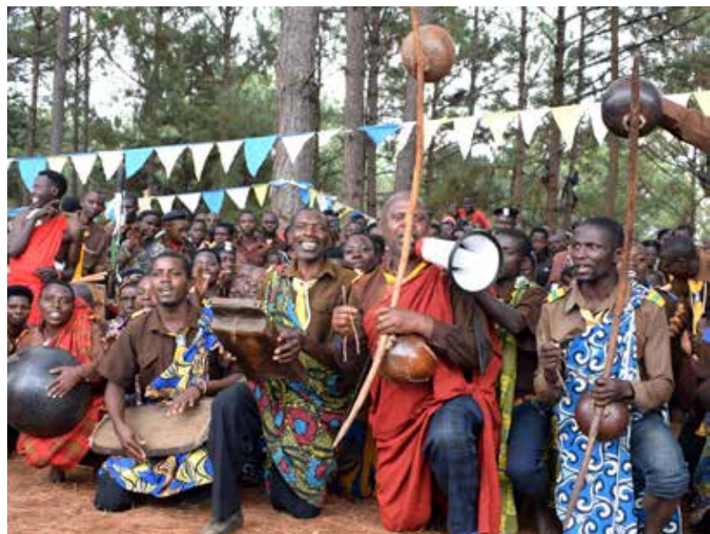
Groupe de musique lors de la caravane culturelle

Médiatrice Irakoze et tous ceux qui se sont exprimés lors du lancement de la caravane culturelle de CHIRO-Bu-