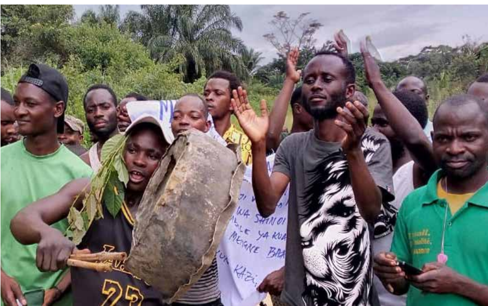
Manifestation du cadre de dialogue pour la paix contre l'exploitation minière dans la chefferie de Wamuzimu