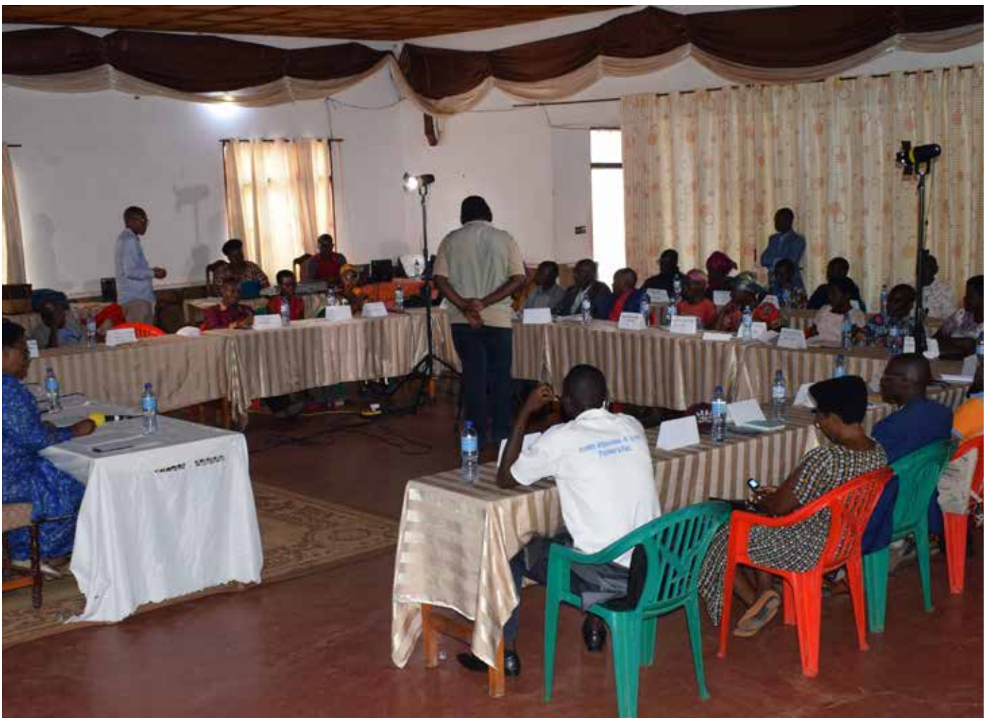
Lors du débat de Makamba

Maisons détruites suite aux intempéries, propriétés foncières occupées, violences domestiques, discrimination, ... : les rapatriés burundais qui regagnent la terre natale surtout depuis 2020 se retrouvent face à de multiples défis. Des acteurs les aident à se réinsérer dans la nouvelle vie, avec des résultats mitigés. Pour cerner la problématique et aider à trouver la « thérapie » appropriée, la Maison de la Presse et l'Association burundaise des Femmes Journalistes ont organisé 02 débats publics radio à Makamba et à Kirundo, fin 2022 dans le cadre du projet « Médias, Paix et Genre (MPG) ».