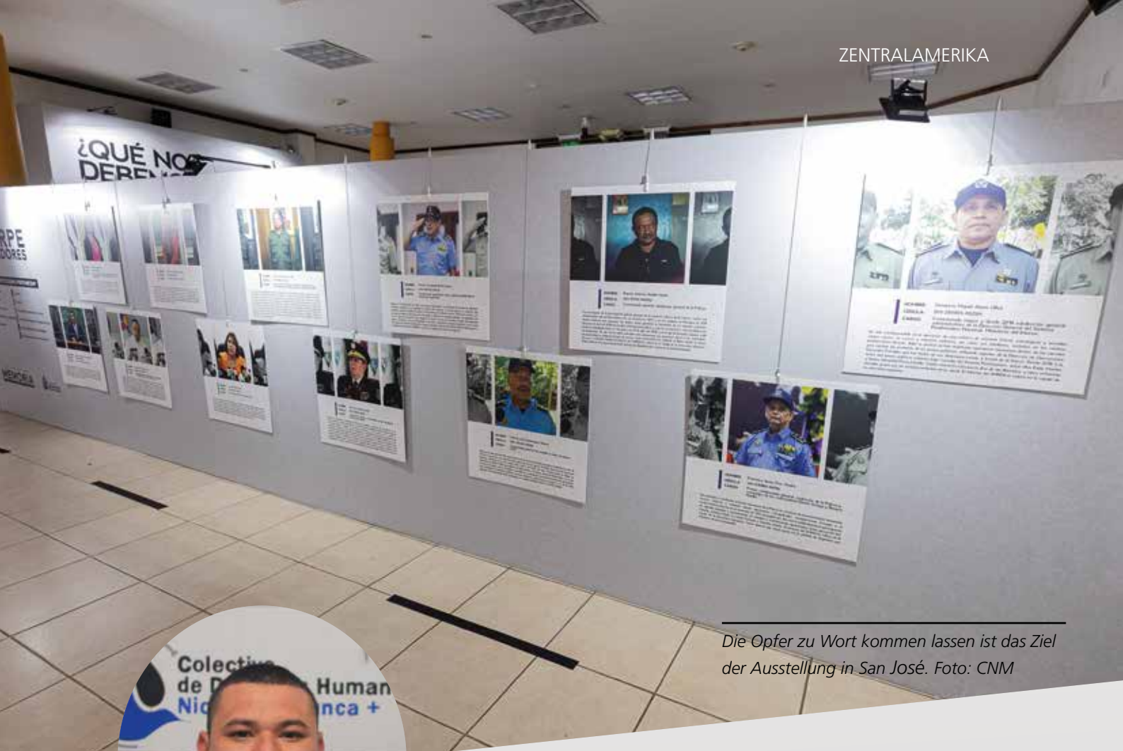
Die Opfer zu Wort kommen lassen ist das Ziel der Ausstellung in San José.