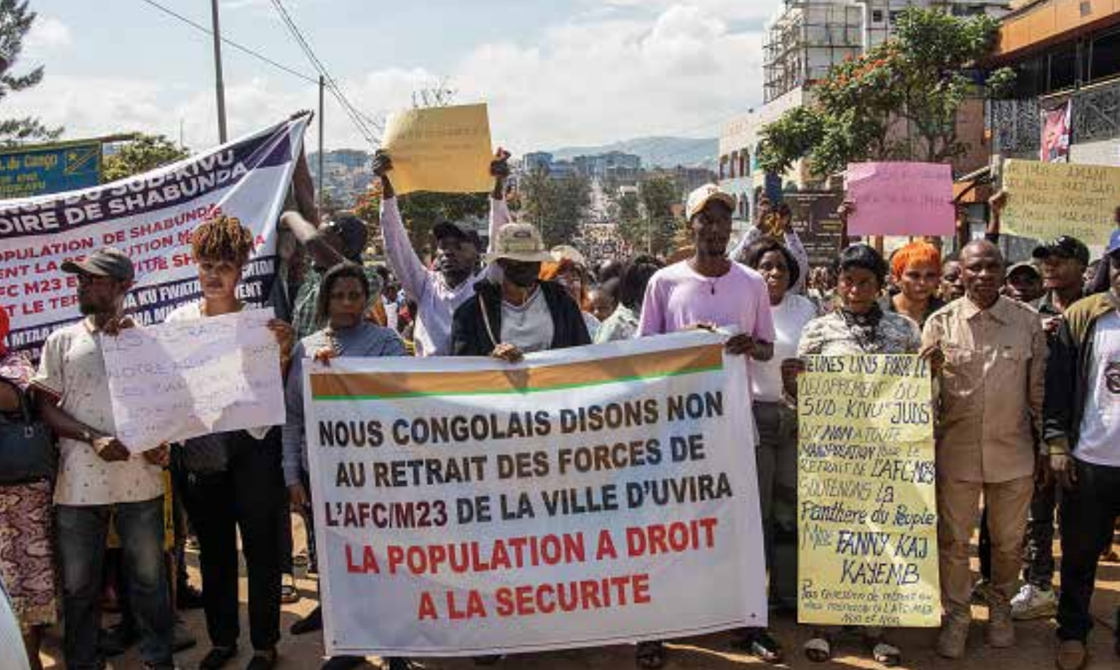
Demonstrant*innen nehmen am 23. Dezember 2025 an einem von zivilgesellschaftlichen Gruppen in Süd-Kivu organisierten Marsch teil, um Frieden und Verständigung in Bukavu zu fordern.

durchsetzbare Verpflichtungen und Fristen festgelegt sind, wird es ein umfassendes Friedensabkommen geben.