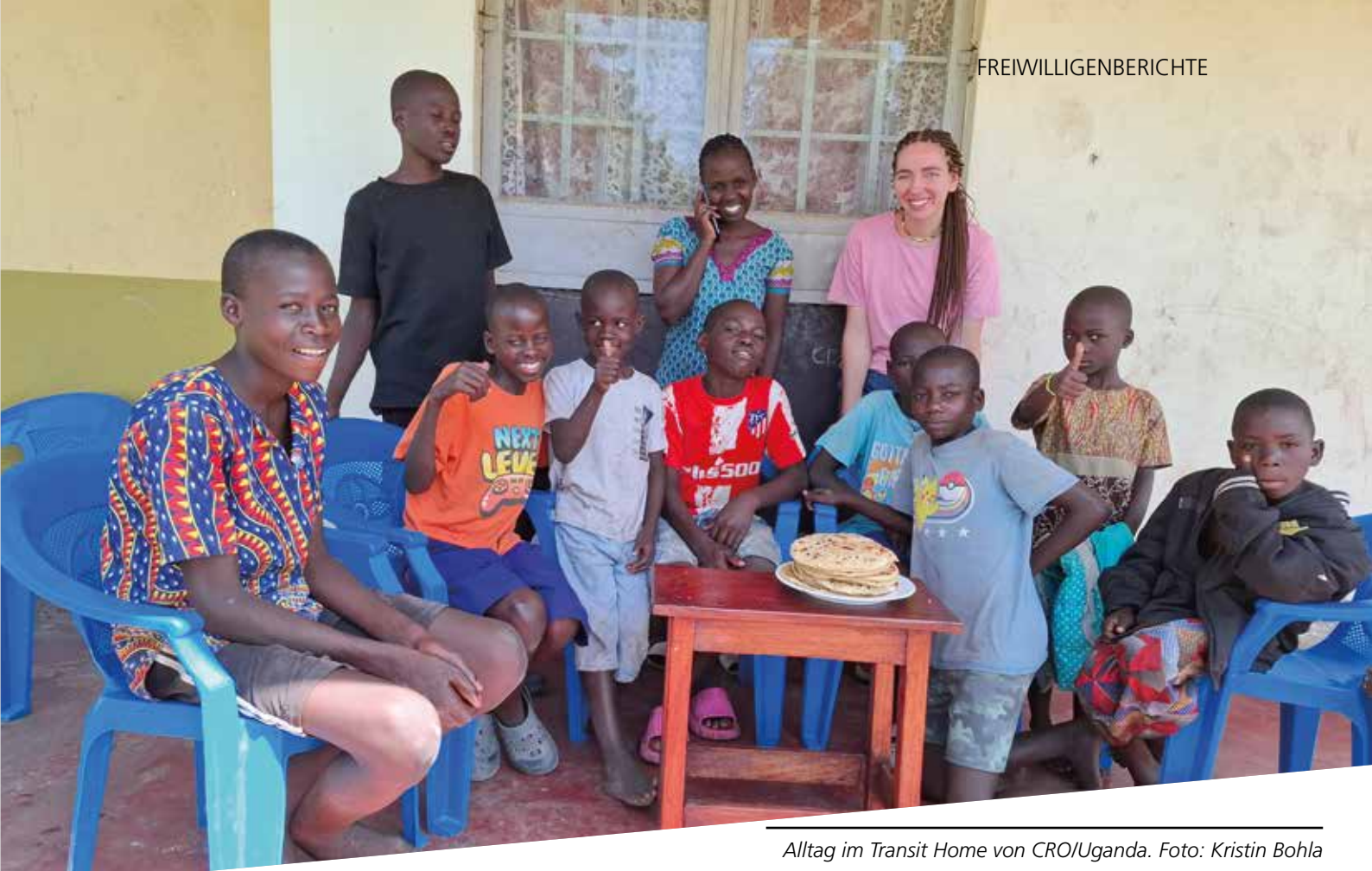
Alltag im Transit Home von CRO/Uganda.

und zu prüfen, ob das Kind dort leben kann. Was mich besonders beschäftigt: Viele Probleme sind strukturell. Reintegrationen scheitern nicht am Willen, sondern an Armut, Überforderung und fehlender Unterstützung. Staatliche Vorgaben verhindern langfristige Lösungen. Bildung bleibt vielen verwehrt. Wenn fünf von zehn Kindern nach der Reintegration zurück auf die Straße gehen, fühlt sich das oft frustrierend an, und gleichzeitig macht es deutlich, dass es hier um mehr geht als Einzelschicksale. Trotzdem erlebe ich auch Hoffnung. Bei CRO geht es nicht nur um Versorgung, sondern um Würde und Perspektiven. In kleinen Projekten lernen die Kinder praktische Fähigkeiten, wie Backen oder eine handwerkliche Ausbildung. Es sind kleine Schritte, aber sie bedeuten Selbstwirksamkeit und Zukunft.