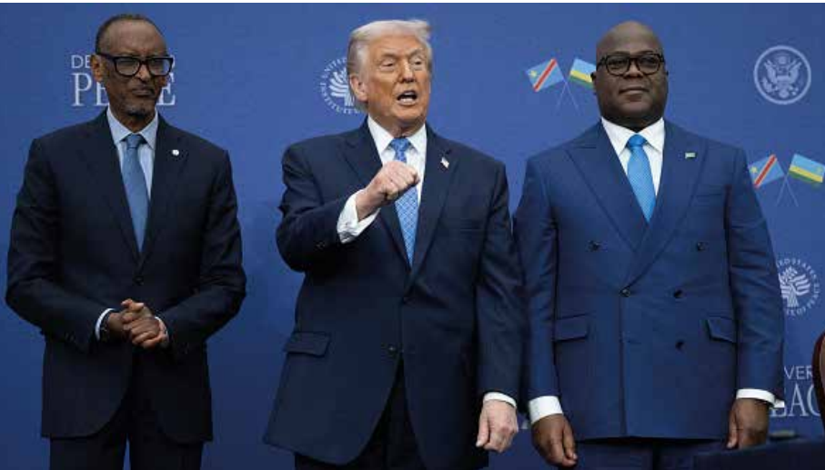
Am 4.12.2026 bringt Donald Trump die Staatschefs von Ruanda, Paul Kagame (l), und der DR Kongo, Felix Tshisekedi (r), zu einem sog. Friedensabkommen zusammen. Trump hofft, dass das Abkommen den Weg für die USA ebnet, Zugang zu kritischen Mineralien im Osten der DRK zu erhalten.

Im Dezember 2025 besetzte die M23 nach erneuten Vorstößen Uvira und die umliegenden Gebiete, was zu neuen Vertreibungen führte und die Angst unter der Zivilbevölkerung weiter schürte. Obwohl sich die Gruppe im Januar 2026 nach starkem internationalem diplomatischem Druck zurückzog, bleibt die humanitäre Lage fragil. Viele Familien sind nach wie vor vertrieben, ihre Lebensgrundlagen sind zerstört und die Bildung der Kinder ist unterbrochen. Viele Zivilist*innen flohen nach Burundi und leben unter erbärmlichen Bedingungen in burundischen Flüchtlingslagern. Grenzüberschreitende Aktivitäten und der Handel zwischen Uvira und Bujumbura sind eingestellt worden, da die Grenze weiterhin geschlossen ist.