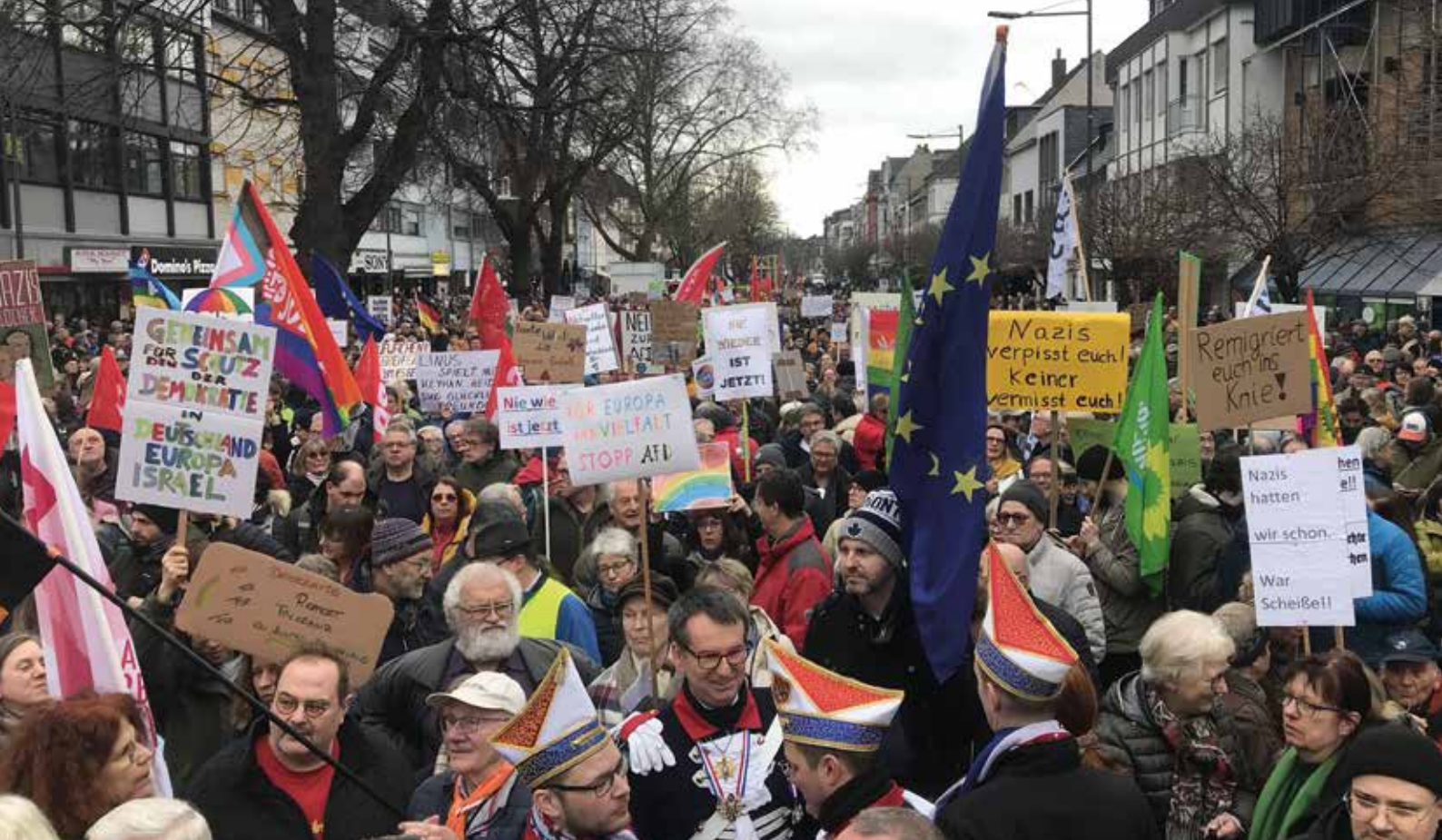
Zivilgesellschaftliches, gewaltfreies Engagement in Neuwied: Im Rahmen des Neuwieder Karnevals protestierten im Februar 2024 Bürger*innen gegen den zunehmenden Rechtspopulismus und das Erstarken der AfD in Neuwied.

von der Universität Köln. Er sagt klar: „Big Tech muss weg“, denn die Entstehung von künstlicher Intelligenz, die sich nur an kapitalistischen Maximen orientiert, birgt eine riesige Gefahr für das Zusammenleben.