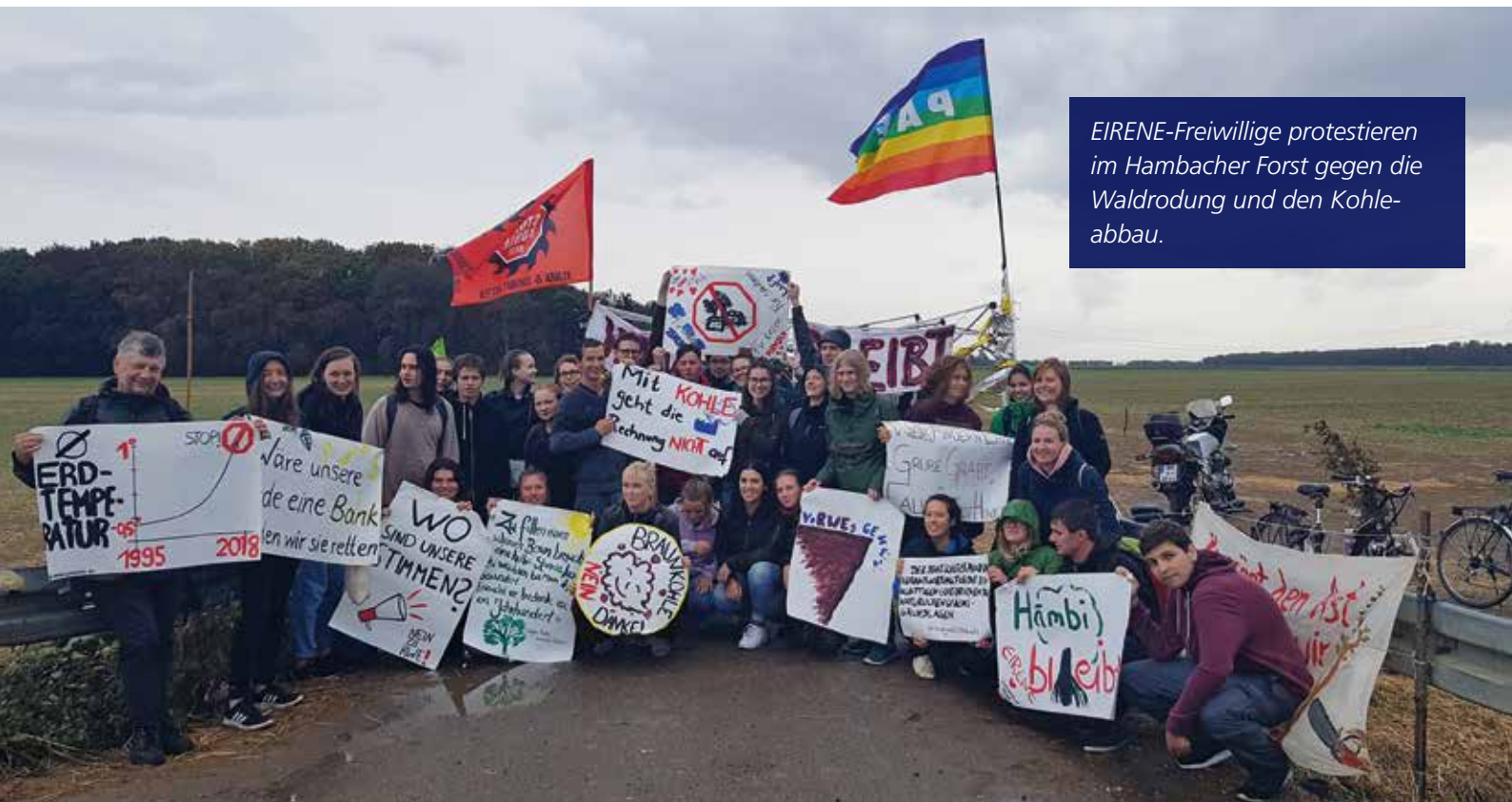
EIRENE-Freiwillige protestieren im Hambacher Forst gegen die Waldrodung und den Kohleabbau.

Macht setzt dabei reale Grenzen. Nicht jedes moralisch überzeugende Ziel ist politisch erreichbar. Das gilt für Regierungen ebenso wie für Nichtregierungsorganisationen. Mehr Druck erweitert Handlungsspielräume nicht automatisch, manchmal verengt er sie. Gleichzeitig bedeutet