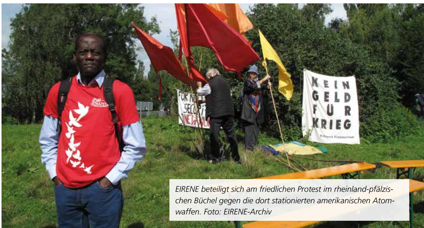
EIRENE beteiligt sich am friedlichen Protest im rheinland-pfälzischen Büchel gegen die dort stationierten amerikanischen Atomwaffen.